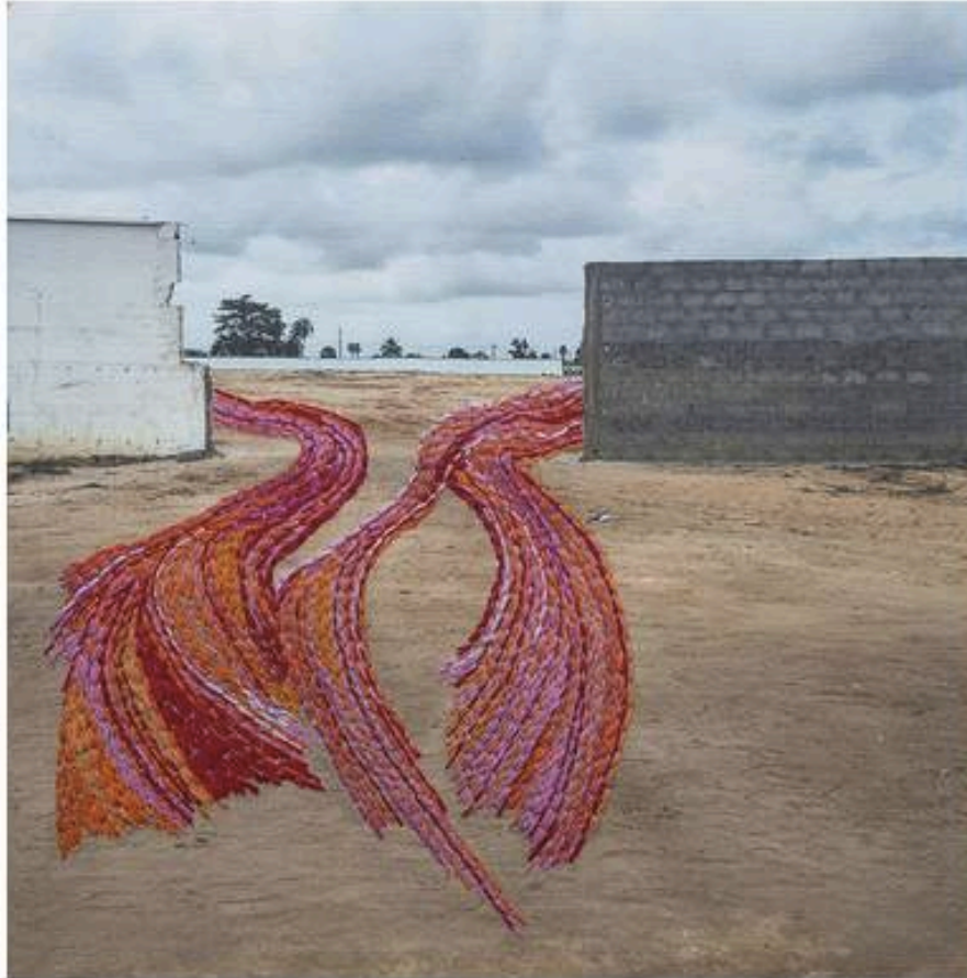
Joana Choumali, Untitled, 2019. From the series: Ça va aller, 2016-19

A voir : l'exposition des 12 finalistes du prix Pictet au Victoria and Albert Museum, Londres, jusqu'au 8 décembre.