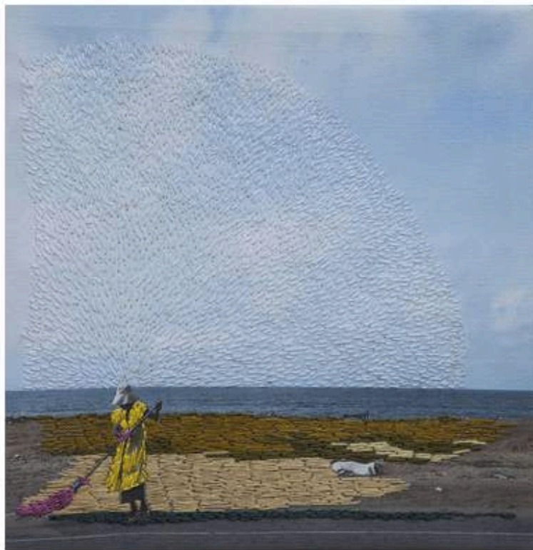
Joana Choumali, Untitled , 2019. From the series: Ça va aller , 2016-19 © Joana Choumali, Prix Pictet

Sur ses instantanés imprimés sur de la toile, l'artiste a entrepris de broder ses rêves et ses pensées. Dans un processus similaire à l'écriture automatique, son imagination court sur le tissu et sculpte un nouveau relief à la scène, modifiant la surface comme le fond de l'image. Une pluie en fil vert tombe du ciel, les arbres se couvrent de fleurs rose vif, de grandes auréoles encerclent un homme, une femme ou un enfant solitaire... "Ça va aller", disent avec pudeur les Ivoiriens pour couper court à la douleur. Et c'est aussi le nom de cette série délicate sur la difficulté à exprimer ses sentiments face à de tels drames.