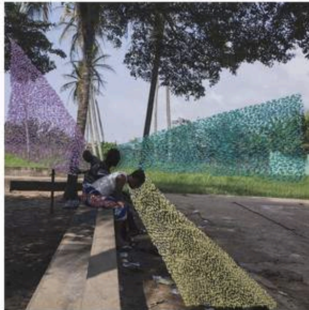
Joana Choumali, Untitled , 2019. From the series Ça va aller , 2016-19

Avec des fils de couleurs, Joana Choumali recoud les blessures de son pays, la Côte d'Ivoire. Trois semaines après l'attentat terroriste de Grand-Bassam, le 13 mars 2016, cette native d'Abidjan a quitté sa résidence d'artiste au Maroc pour venir photographier à l'iPhone les rues et le littoral meurtris de la cité historique et balnéaire où, petite, elle passait ses vacances. Le bord de mer est déserté, les palmiers coupent la ligne d'horizon, de rares personnages traversent ces paysages mélancoliques. D'habitude si animée, la ville est alors frappée de mutisme et d'effroi.